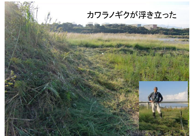
カワラノギクが浮き立った