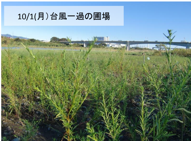
10/1(月)台風一過の圃場

9/30(日)大型台風17号の影響と今年芽生えたカワラノギク-ロゼットの観察記録です。芽吹きは8月下旬の雨の後に多数芽生えました。 10/27(土)さがみはら地域協議会の圃場、「カワラノギク」を守る会圃場、神川橋下圃場のお花見会。10/28(日)馬入水辺の楽校お花見会予定。