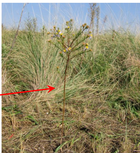
圃場から100m程離れ、シナダレスズメガヤが群生した中に一本の”カワラノギク”が花をつけていた。風散布、付着散布のいずれかは不明だが”奇跡的の一本”に見え感動した。